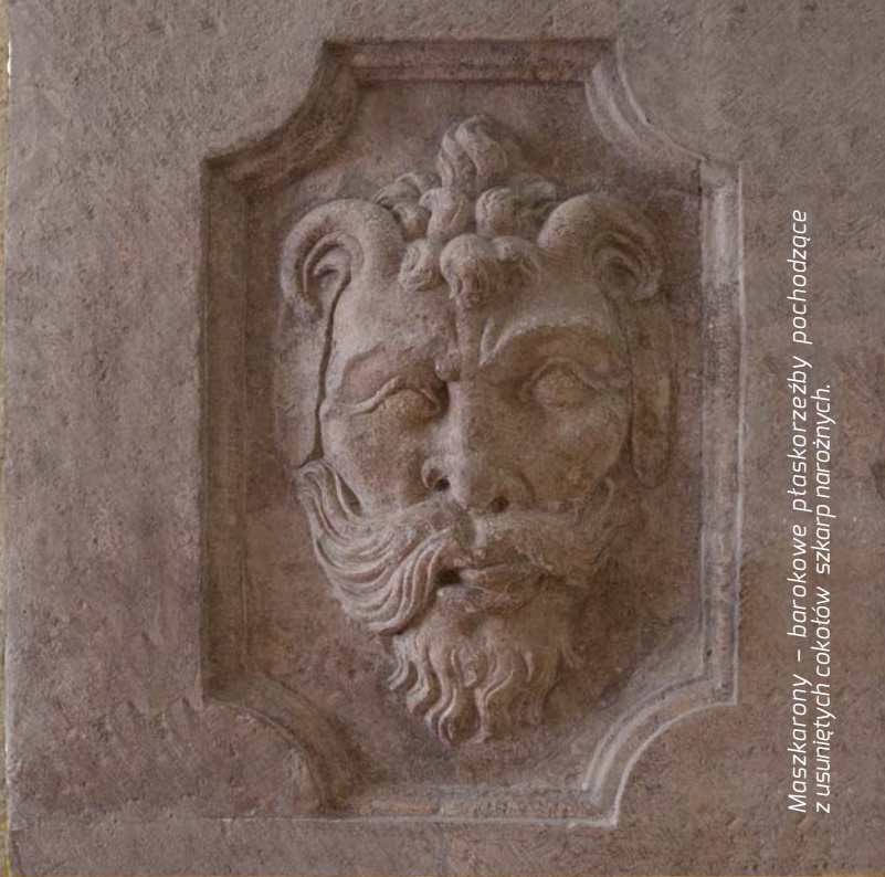
Maszkarony – barokowe płaskorzeźby pochodzące z usuniętych cokołów szkarp narażonych.