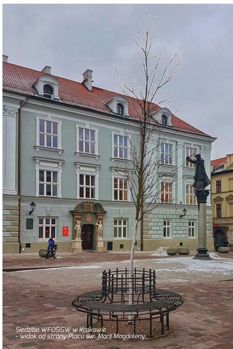
Siedziba WFOŚiGW w Krakowie - widok od strony Placu św. Marii Magdaleny.