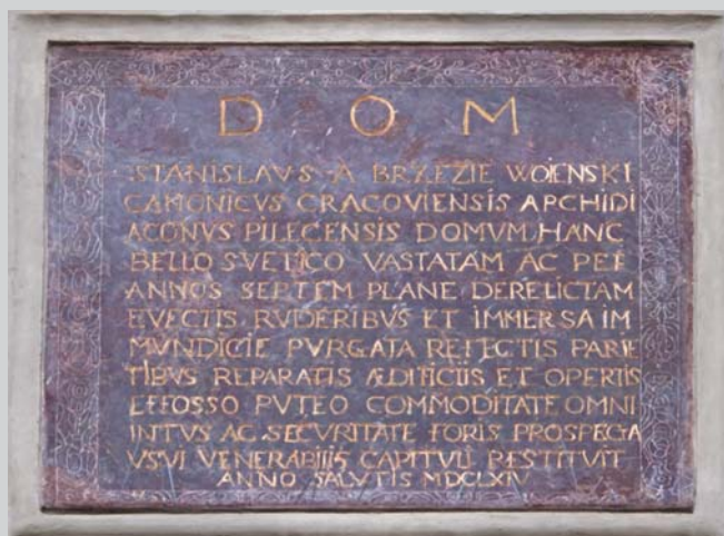
Tablica z łacińskim napisem, umieszczona nad wejściem.