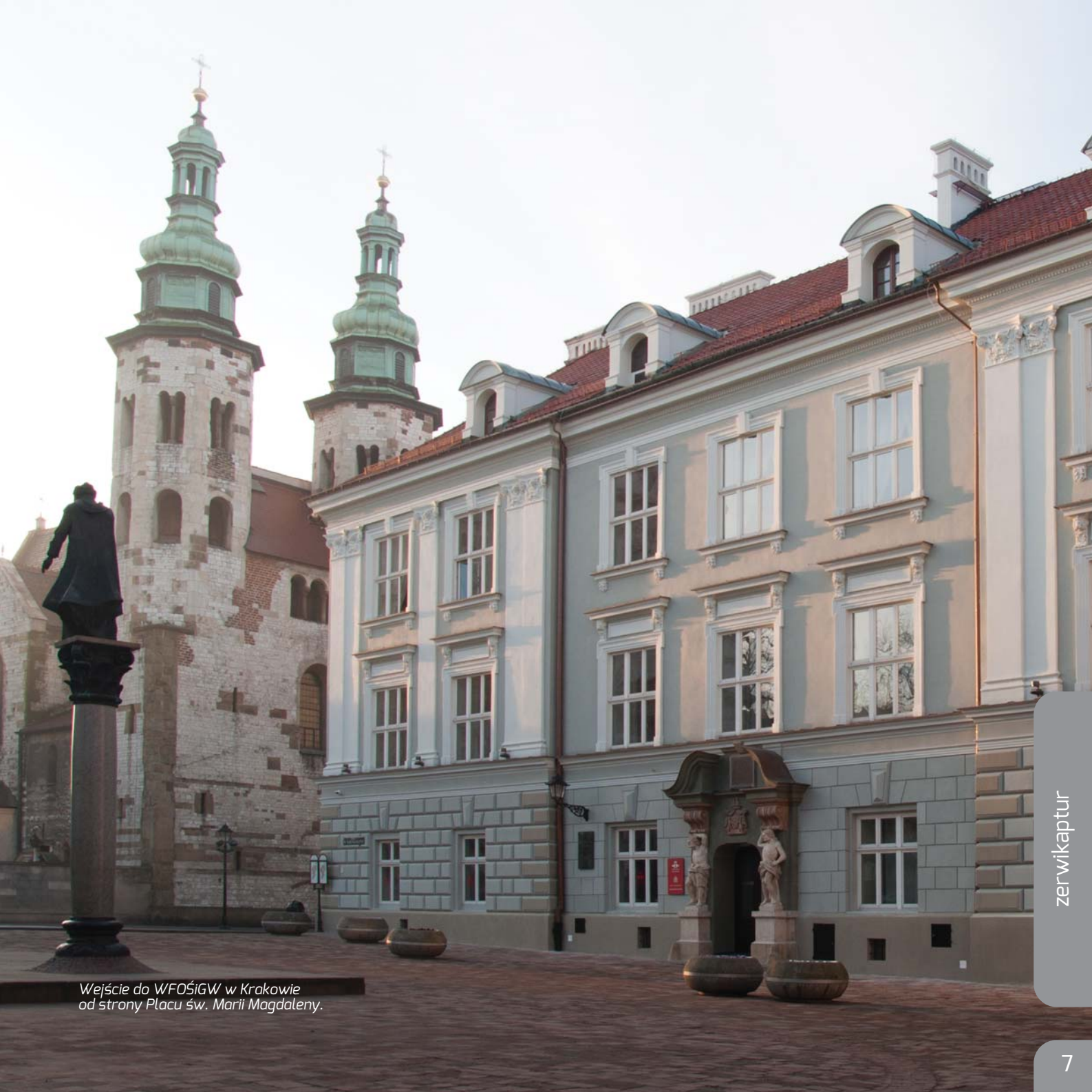
Wejście do WFOŚiGW w Krakowie od strony Placu św. Marii Magdaleny.