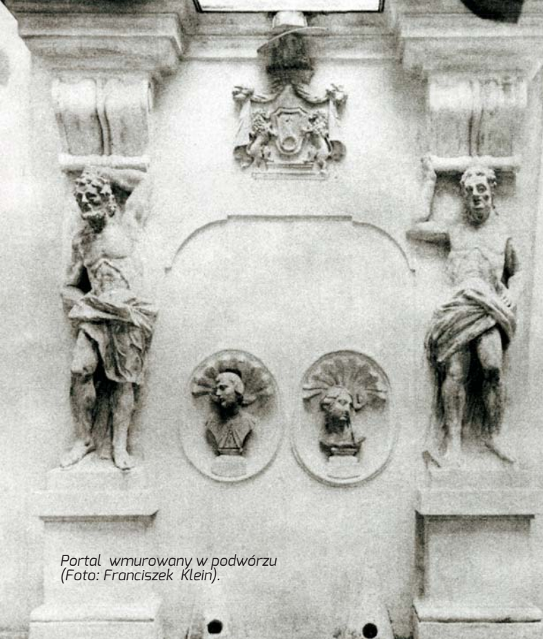
Portal wmurowany w podwórzcu.

(trzy osie środkowe flankowane mało wydatnymi ryzalitami dwuosioowymi), boczna od ulicy Kanoniczej trójosiowa (w tym dwie osie w ryzalicie zintegrowanym z analogicznym ryzalitem w fasadzie), boczna od ulicy Grodzkiej pięćosiowa. Artykulację poziomą nad parterem i pod okapem, tworzą szerokie pasy pełnego belkowania (gładki fryz między profilowanym architrawem a bogato profilowanym gzymsiem, w partii podokapowej wzbogaczonym kostkowaniem i kymationem). Podział poziomy podkreśla dodatkowo zróżnicowane opracowanie lica parteru i wyższych kondygnacji. Parter jest rustykowany, z boniami w środkowej części fasady wycinanymi w tynku, a w ryzalitach modelowanymi głęboko jako fasety o profilowanych krawędziach. Bonie narożne, na przemian dłuższe i krótsze, pełnią dodatkowo funkcję dekoracyjnych „ściągaczy”. Wyższe kondygnacje tynkowane są gładko i artykułowane pionowo pilastrami wielkiego porządku. Ich kapitele, zbliżone do korynckich, ozdabia powtarzalny motyw panoplii, skomponowany z baniastego hełmu rycerskiego z opuszczoną przyłbicą, który umieszczony jest między rękojeścią miecza, a głownią halabardy i wsparty na stosie kul armatnich. Ryzality w fasadzie opięte są pilastrami zdwojonymi. Otwory okienne w strefie parteru ujęte są w gładkie opaski wycinane w rustyce. Ich nadproża mają bonie o formie klinowej, a klucze zaakcentowane są jako rustyka diamentowa.