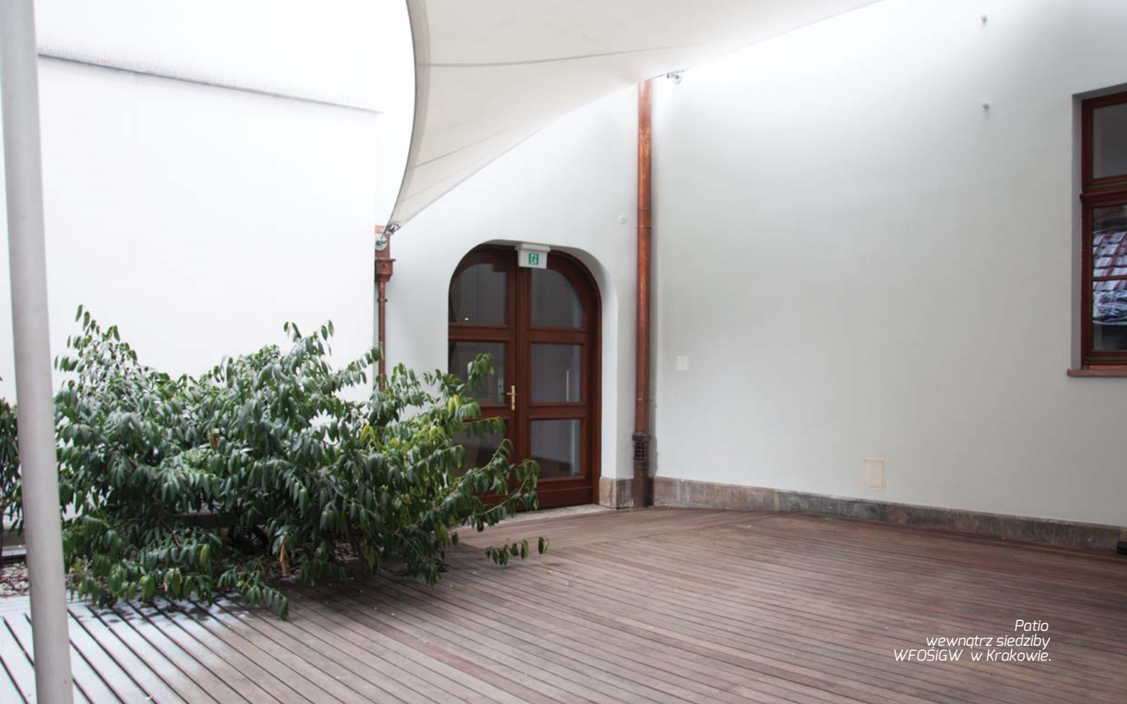
Patio wewnątrz siedziby WFOŚiGW w Krakowie.