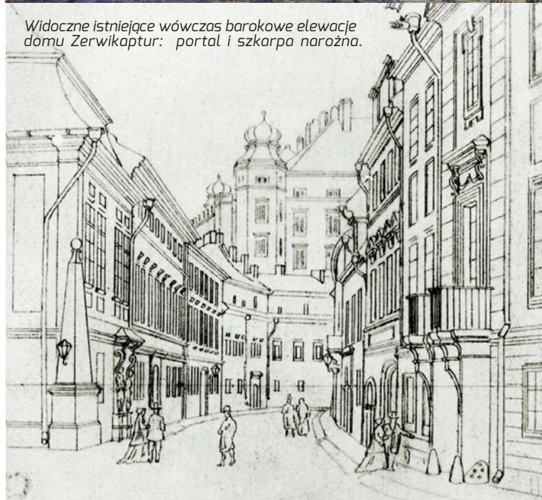
Widoczne istniejące wówczas barokowe elewacje domu Zerwikaptur: portal i szkarpa narożna.