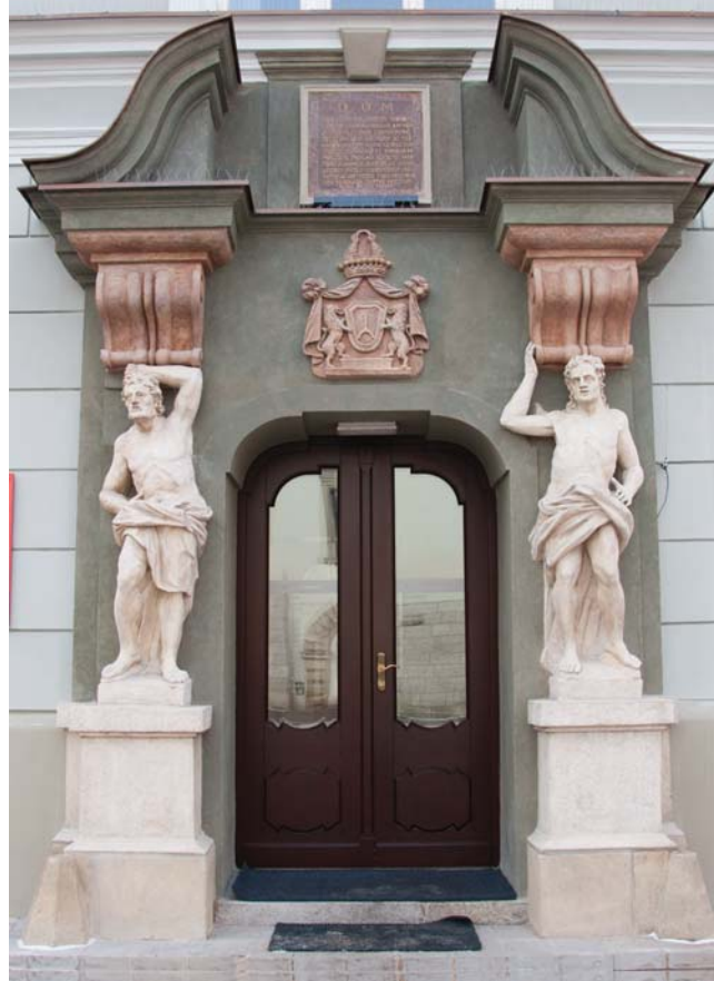
Barokowy portal w elewacji od Placu św. Marii Magdaleny.