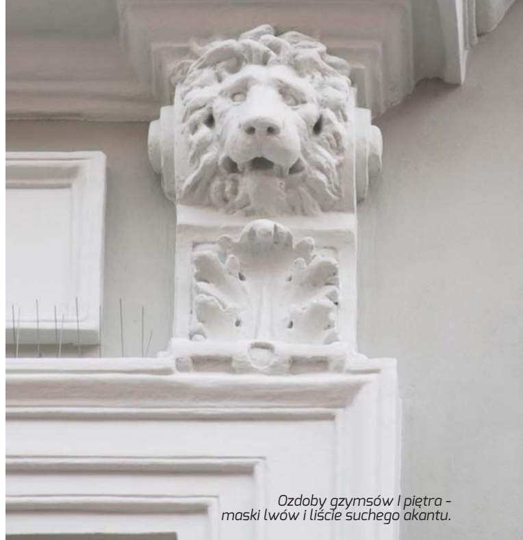
Ozdoby gzymsów I piętra - maski lwów i liście suchego akantu.

w połowie wysokości, ujęte są w uszate obramienia, profilowane w tynku. Okna na I piętrze wieńczą odcinki prostych gzymsów, wspartych na wolutowych konsolach ozdobionych motywem liści suchego akantu i maskami lwów. Między konsolami widoczne są prostokątne płyciny. Okna na II piętrze w analogicznych profilowanych opaskach uszatech, jednak dla odmiany z nadprożami akcentowanymi przez klucze w formie zdwojonych kłinców oraz parapetami wspartymi na płaskich wspornikach, dekorowanych odlewami liści suchego akantu. Portale w poszczególnych elewacjach rozwiązane są w różny sposób. Główny portal na osi elewacji frontowej, zlokalizowany w obecnym miejscu wtórnie (por. historia) wyróżnia się bogatym opracowaniem rzeźbiarskim, wykonanym z kamienia. Skomponowany jest z dwóch pełnoplastycznych figur atlantów (Atlasów), atletycznych postaci z opaskami na biodrach, stojących po bokach wejścia na wysokich postumentach. Każda z ich jedną uniesioną ręką podtrzymuje wolutowe konsole pod wolutowym i przerwany przyczółkiem. Między splotami przyczółka kartusz z herbem Ogończyk flankowany przez dwa lwy, stojące antytetycznie, umieszczony jest na tle draperii spiętej od góry dziewięciopalczystą koroną hrabiowską (1778 r.). Ponad herbem znajduje się tablica erekcyjna z czerwonego marmuru (węgierskiego lub „Zygmuntówka”), z majuskułowym napisem łacińskim, którego treść w tłumaczeniu polskim zamieszczona jest powyżej, w nocie o historii domu.