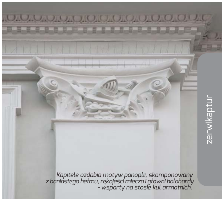
Kapitele ozdabia motyw panoplii, skomponowany z baniasztowego hełmu, rękojeści miecza i głowni halabardy - wsparty na stosie kul armatnich.