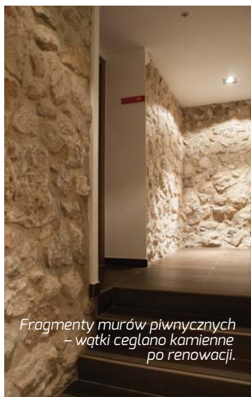
Fragmenty murów piwnicznych – wątki ceglano kamienne po renowacji.