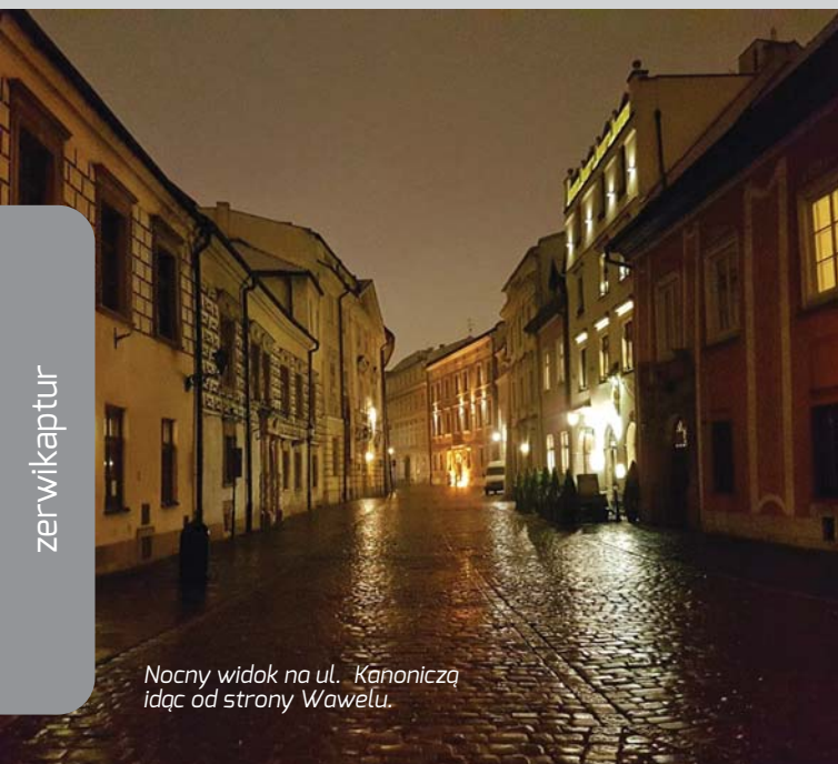
Nocny widok na ul. Kanoniczą idąc od strony Wawelu.