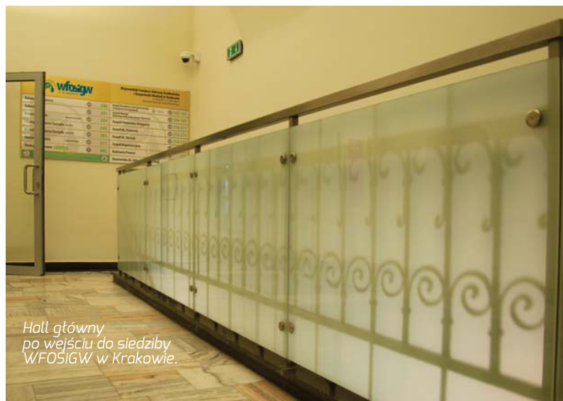
Hall główny po wejściu do siedziby WFOŚiGW w Krakowie.